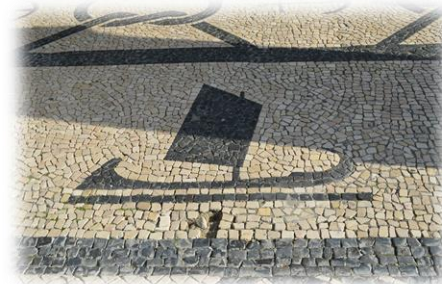
Usada para fins de vandalismo