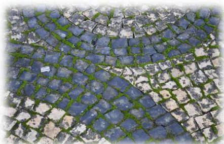
Juntas propícias ao aparecimento de ervas