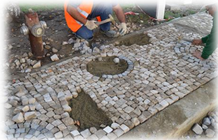
Mão de obra especializada